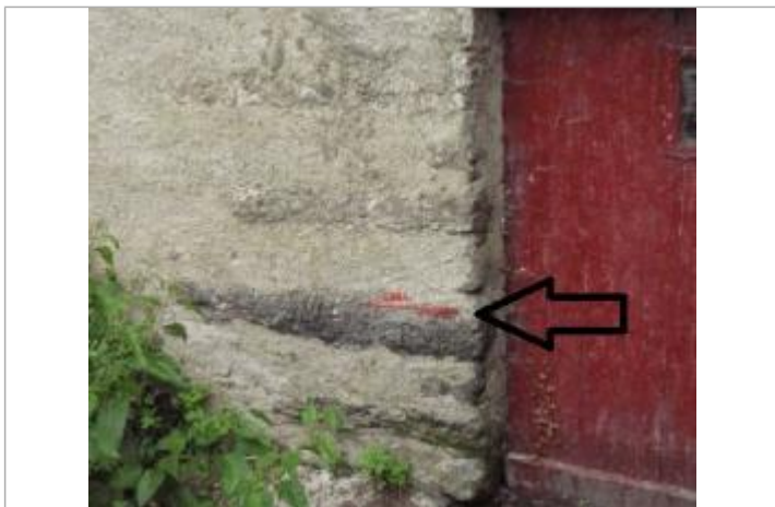
Marque de crue