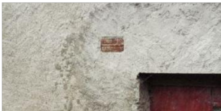
Plaque du 03 mars 1930