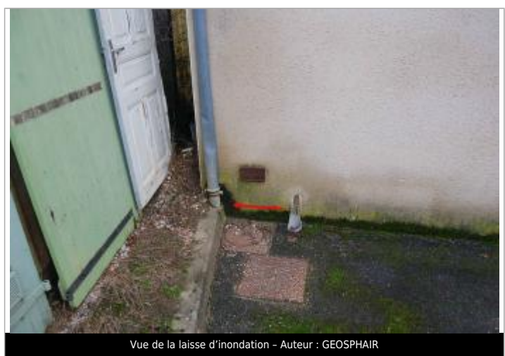
Vue de la laisse d'inondation - Auteur : GEOSPHAIR

GÉNÉRAL Code : GTL_R_6754_2 Date de mise à jour : 22/06/2018 Auteur : SPC GTL