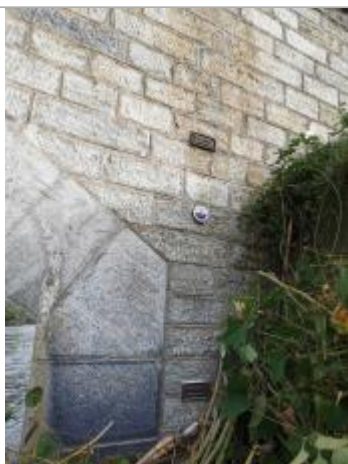
Repère normalisé au dessus du repère de 1897

Différence entre le niveau d'eau et la référence (en m) : 0.600 m