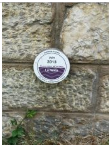
Vue rapprochée du repère, 2023.