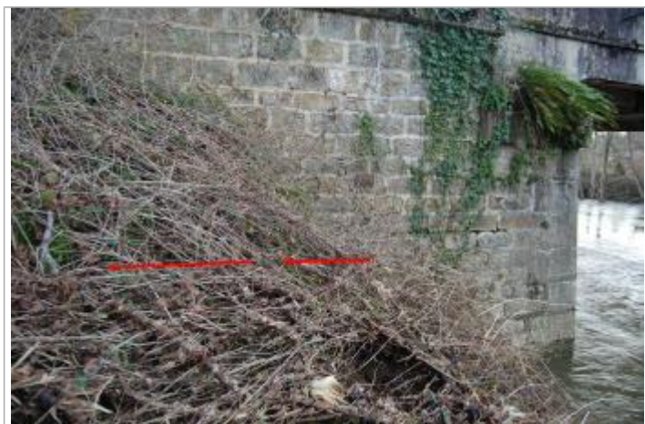
Vue de la laisse d'inondation

Altitude calculée de l'eau (en m) : 182.32