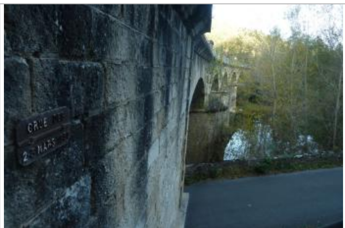
culée pont voie ferrée face amont rive gauche

Altitude calculée de l'eau (en m) : 151.26