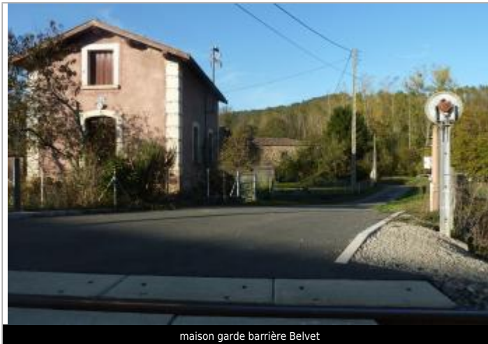
maison garde barrière Belvert