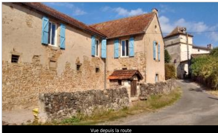
Vue depuis la route

Coordonnées WGS84 : X: 1.94121000 / Y: 44.07040000