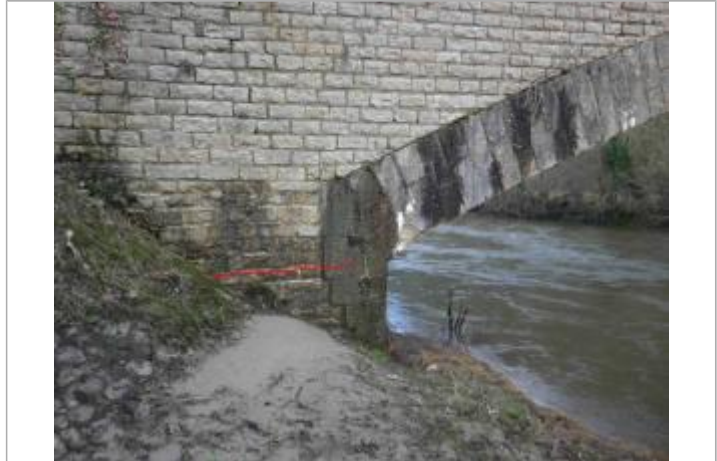
Vue de la laisse d'inondation

GÉNÉRAL Code : GTL_R_6578_2 Date de mise à jour : 25/05/2018 Auteur : SPC GTL