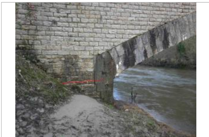
Vue de la laisse d'inondation - Auteur : GEOSPHAIR

Altitude calculée de l'eau (en m) : 172.838