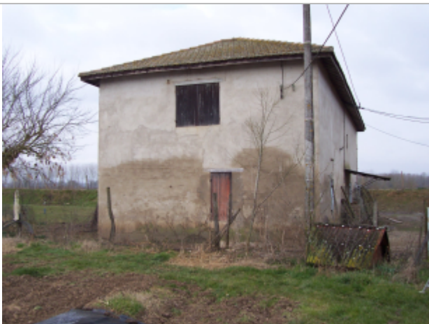
Photo du recensement d'origine, auteur photo : Risque et Territoire

Altitude calculée de l'eau (en m) : 28.81