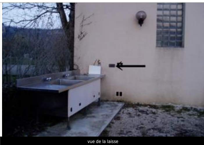
vue de la laisse

Altitude calculée de l'eau (en m) : 154.66