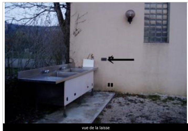
vue de la laisse