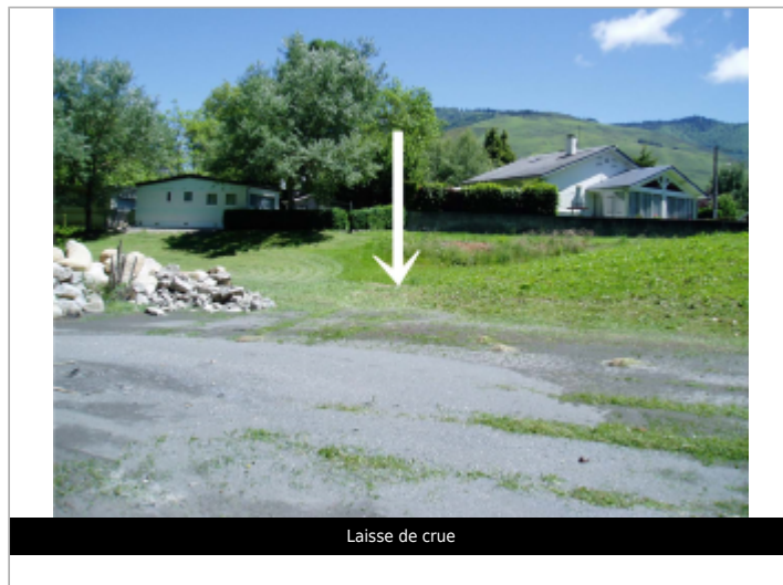
Laisse de crue