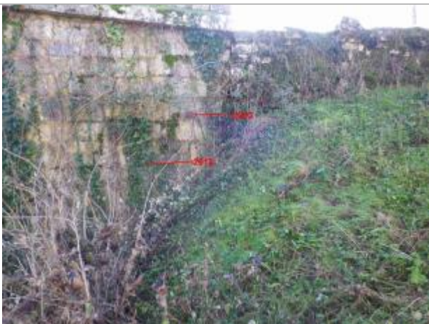
Vue de la laisse d'inondation - Auteur : GEOSPHAIR

Altitude calculée de l'eau (en m) : 143.25