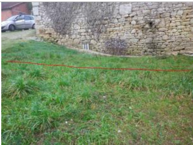
Vue de la laisse d'inondation - Auteur : GEOSPHAIR

Altitude calculée de l'eau (en m) : 133.526