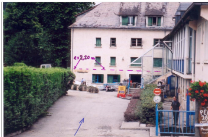
Photo du recensement d'origine.