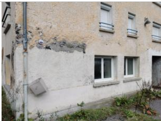
Repère normalisé. 2022

Différence entre le niveau d'eau et la référence (en m) : 2.200 m