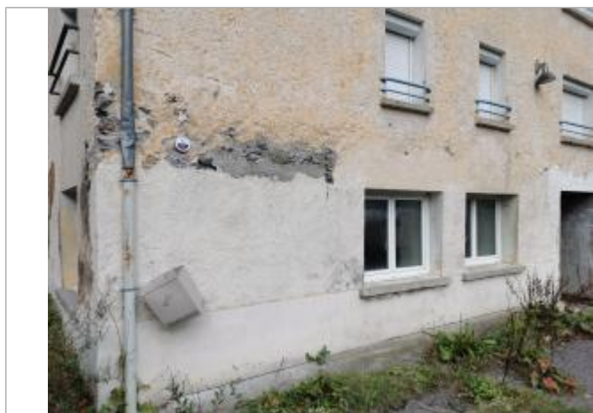
Repère normalisé, 2022

Différence entre le niveau d'eau et la référence (en m) : 2.200 m