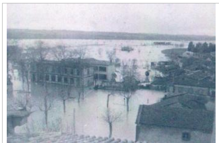
photo de la crue du 2 février 1952

Système altimétrique : NGF IGN 1969 (système normal)