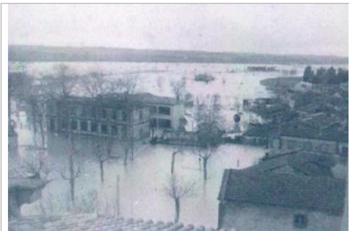
photo de la crue du 2 février 1952