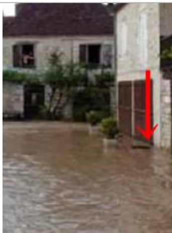
Photo du recensement d'origine.

Système altimétrique : NGF IGN 1969 (système normal)