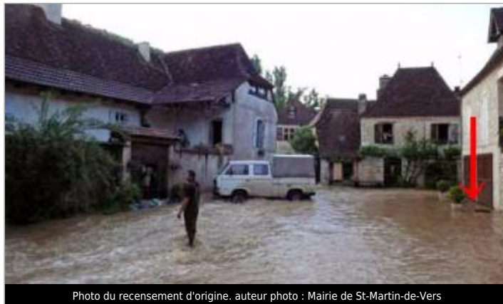
Photo du recensement d'origine.