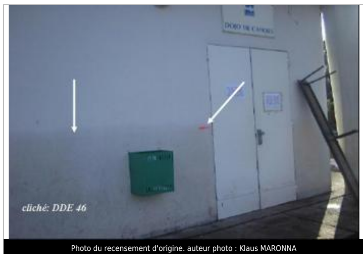
cliché: DDE 46

Maximum de l'inondation : Oui Visibilité : Non renseigné Repère calculé : Non Pérennité : Non renseigné PHEC : Non renseigné