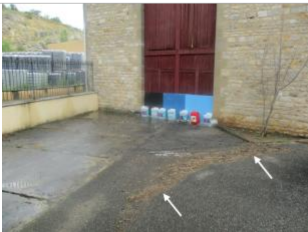
auteur photo : DDT46

SOURCE DE REPÉRAGE : DDT 46 - 04/12/2017