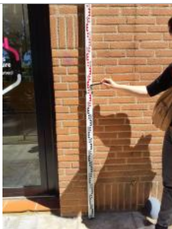
Photo du repère 29/04/2025

Altitude calculée de l'eau (en m) : 139.15