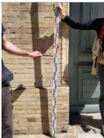
Photo du repère - 29/04/2025

Altitude calculée de l'eau (en m) : 139.3