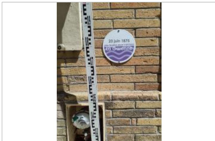
Photo du repère - mesure 0.8 m

Altitude calculée de l'eau (en m) : 140.291