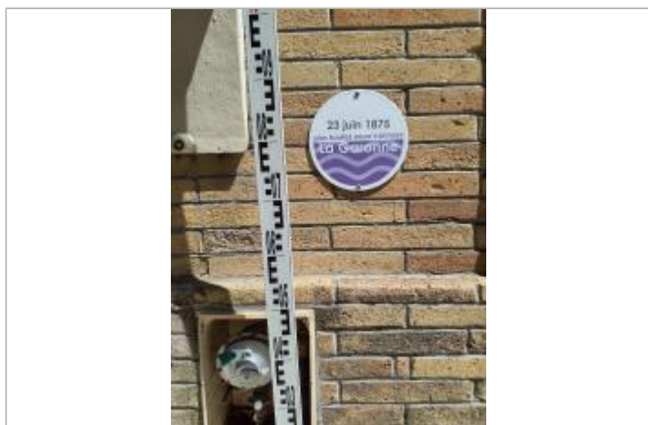
Photo du repère - mesure 0.8 m

Altitude calculée de l'eau (en m) : 140.291