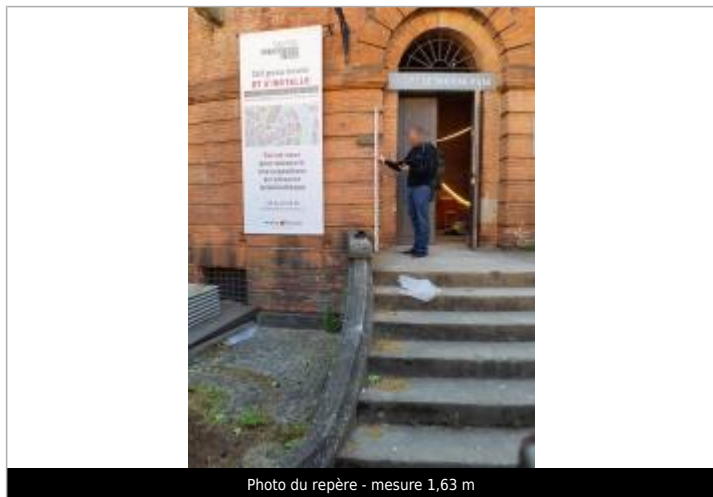
Photo du repère - mesure 1,63 m

Altitude calculée de l'eau (en m) : 139.919