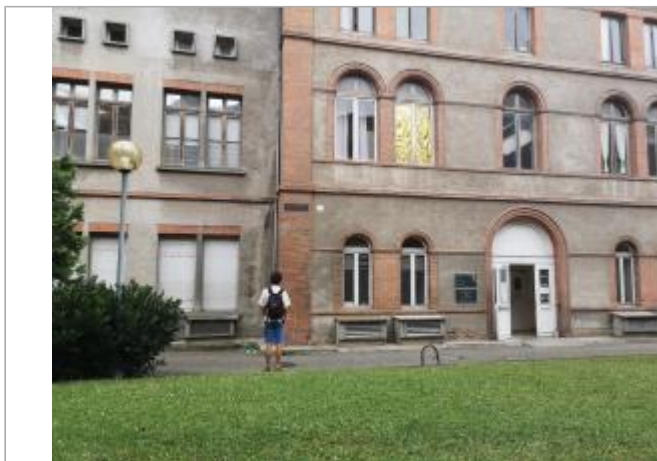
Vue du site (2023)

Coordonnées WGS84 : X: 1.43605000 / Y: 43.60010000