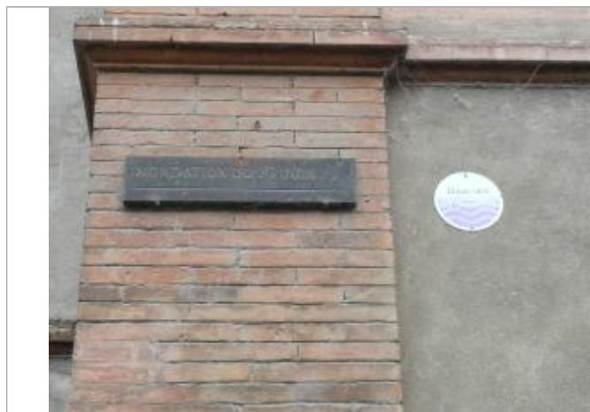
Vue du repère (2023)

Altitude calculée de l'eau (en m) : 139.57