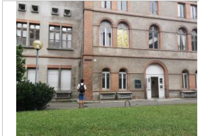
Vue du site (2023)