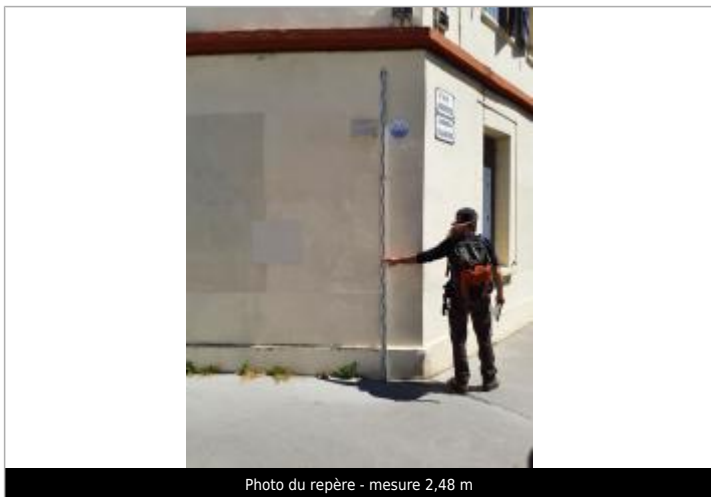
Photo du repère - mesure 2,48 m

MARQUE Maximum de l'inondation : Oui Visibilité : Oui État du repère : Bon Pérennité : Longue