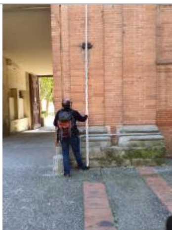
Photo du repère - cote lue 3,01 m

Altitude calculée de l'eau (en m) : 138.584