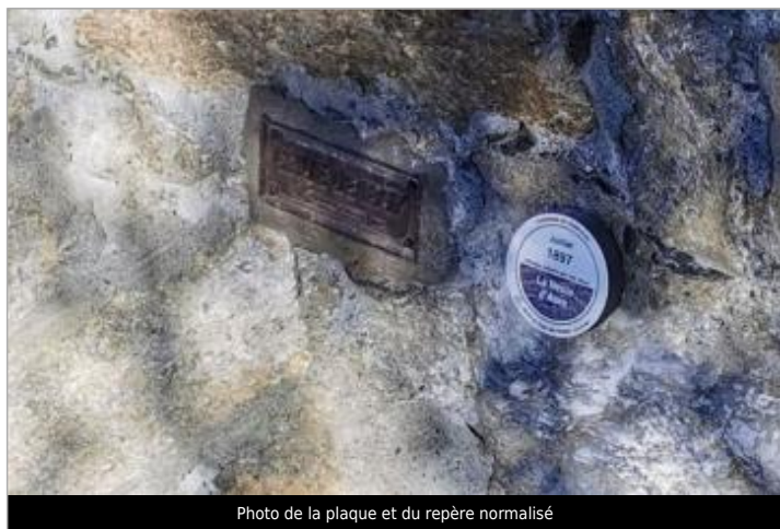
Photo de la plaque et du repère normalisé