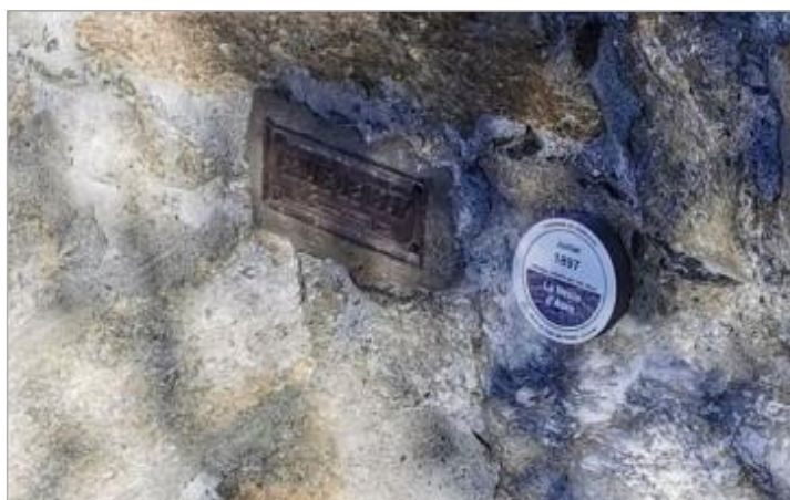
Photo de la plaque et du repère normalisé