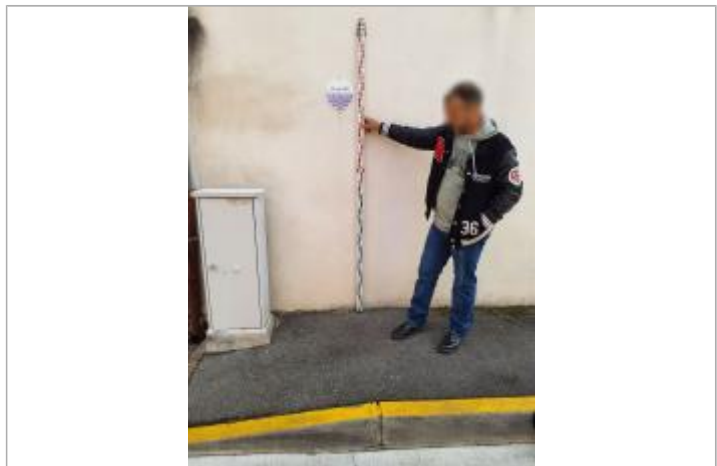
Photo du repère - mesure 1.63 m

GÉNÉRAL Code : GTL_R_633 Date de mise à jour : 06/08/2025 Auteur : SPC GTL