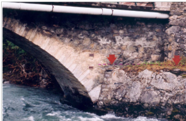
Photo du recensement d'origine.

Coordonnées WGS84 : X: 0.32832306 / Y: 42.82953730