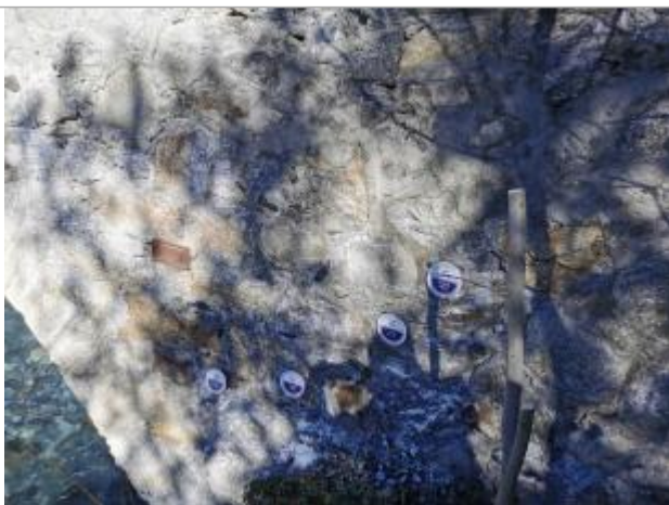
Repère normalisé. 2022

Différence entre le niveau d'eau et la référence (en m) : 0.300 m