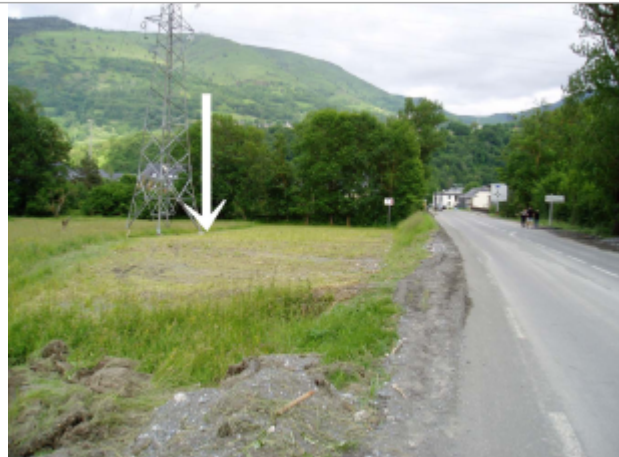
Limite entre l'herbe couchée et celle qui est restée debout