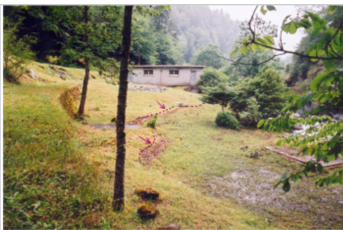
Photo du recensement d'origine. auteur photo : DIREN Midi-Pyrénées

GÉOLOCALISATION Coordonnées WGS84 : X: 0.29940200 / Y: 42.79250000 Coordonnées RGF93 (Lambert 93) X: 478847.84 / Y: 6191891.44 Coordonnées RGF93 (ETRS89) : X: 0.299402 / Y: 42.7925 Code Hydro: 001-0400 Rive de référence: Gauche