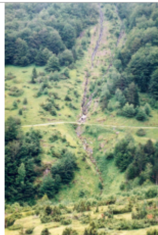
Photo du recensement d'origine.