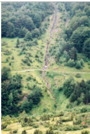
Photo du recensement d'origine.