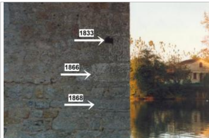
Les 3 repères du site

Coordonnées WGS84 : X: 0.99508900 / Y: 44.48610000