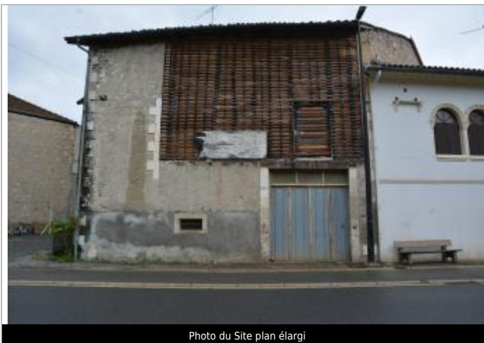
Photo du Site plan élargi

Coordonnées WGS84 : X: 0.96207411 / Y: 43.10405480