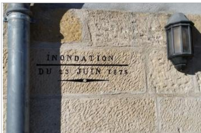
Marque gravée © Syndicat Rivières Salat Volp

Altitude calculée de l'eau (en m) : 293.12