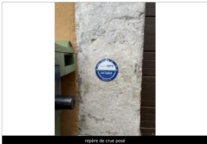
repère de crue posé

Altitude calculée de l'eau (en m) : 303.75