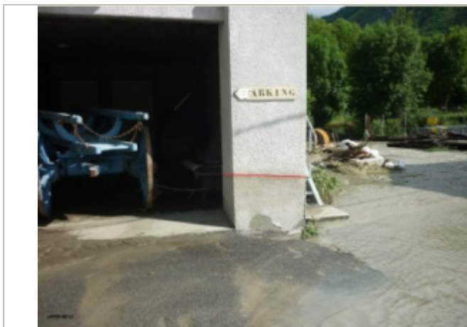
Siège de la boule Saint Béataise

Coordonnées WGS84 : X: 0.69254991 / Y: 42.90612500