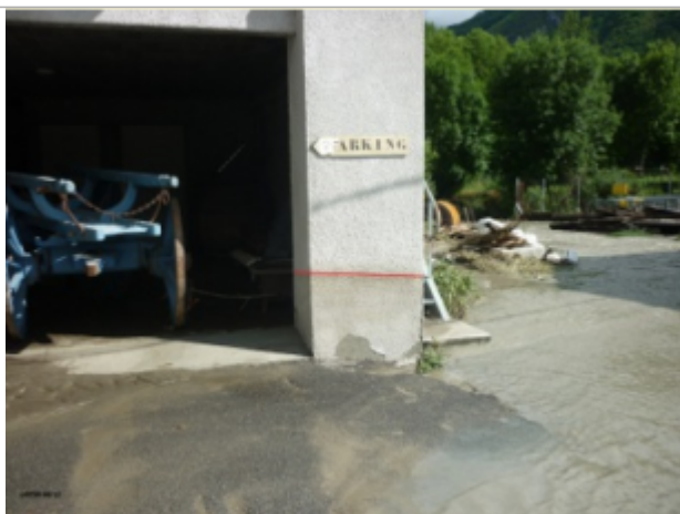
Siège de la boule Saint Béataise

Différence entre le niveau d'eau et la référence (en m) : 0.650 m