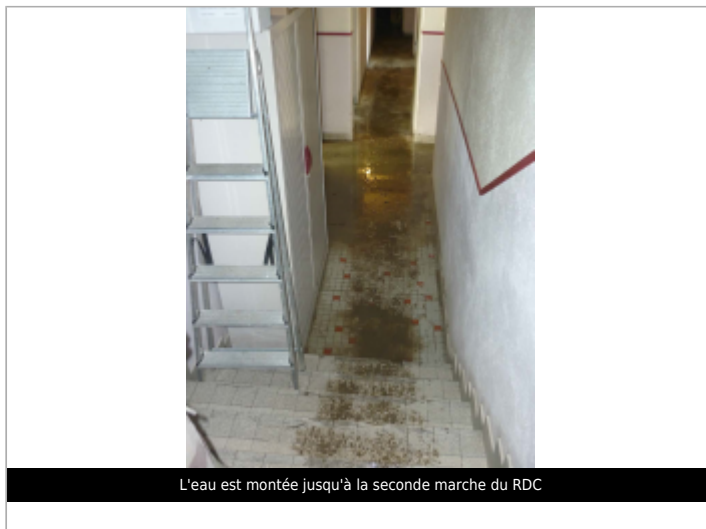
L'eau est montée jusqu'à la seconde marche du RDC