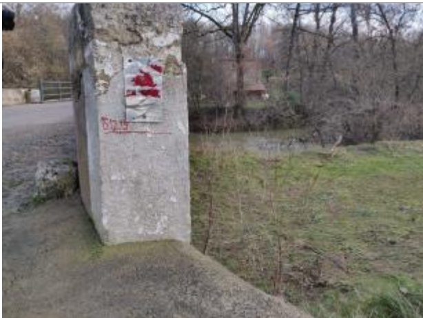
Vue pile amont du pont RG