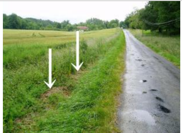
Vue vers l'amont, sur le moulin. En contrebas de la route la crue a déposé une laisse.