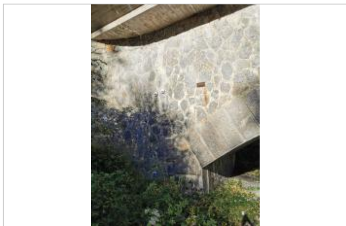
L'ancien repère est sur l'amont. Nous avons placé les trois repères sur la même culée côté amont. Les deux plus haut sont décalés, car leurs proximités en altimétrie ne permettent pas de les mettre l'un au-dessus de l'autre.

Code : GTL_R_922 Date de mise à jour : 10/10/2023 Auteur : SPC GTL