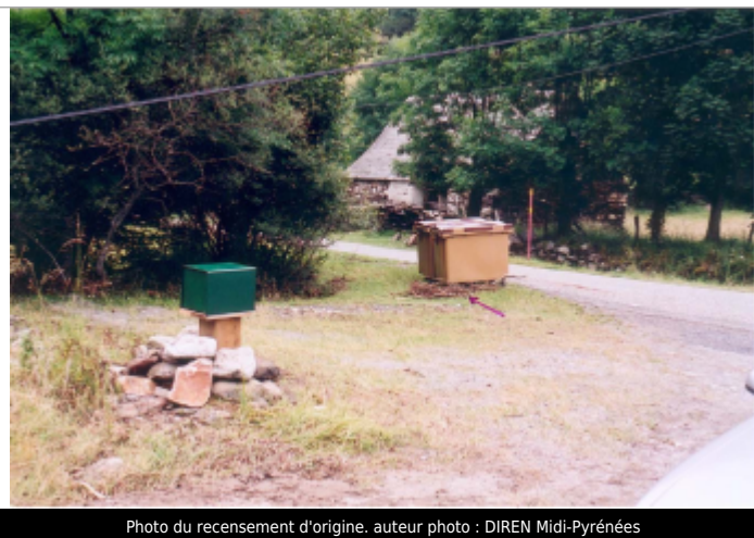
Photo du recensement d'origine.