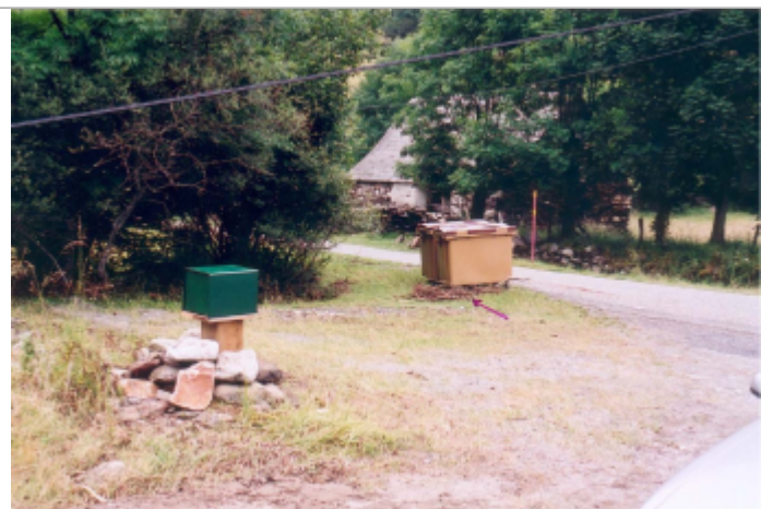
Photo du recensement d'origine.

Système altimétrique : NGF IGN 1969 (système normal)