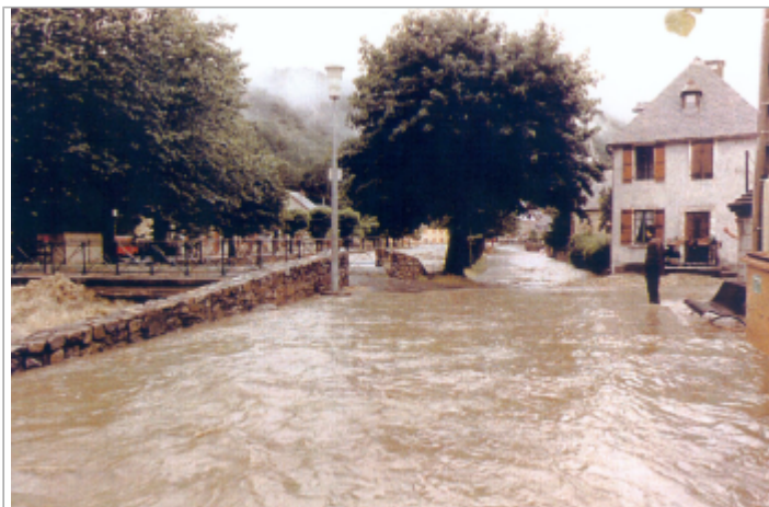
Photo du recensement d'origine.

Coordonnées WGS84 : X: 0.39594200 / Y: 42.87120000