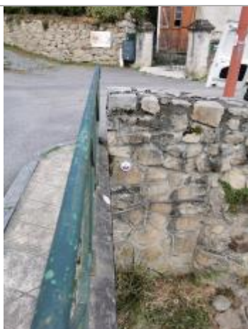
Repère normalisé. 2022

Système altimétrique : NGF IGN 1969 (système normal)