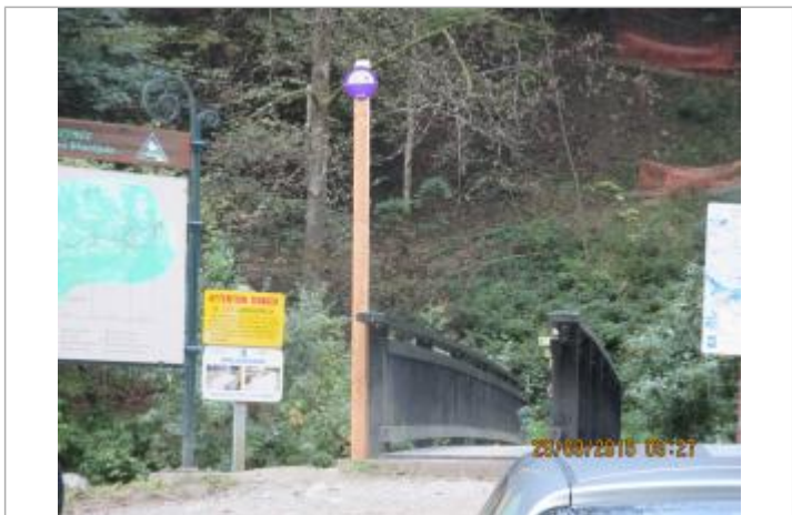
crue du 12/07/1892

MARQUE Texte : Le Bonnant 12 Juillet 1892 Plus Hautes Eaux Connues Maximum de l'inondation : Oui Visibilité : Oui État du repère : Bon Pérennité : Longue Repère calculé : Non PHEC : Oui