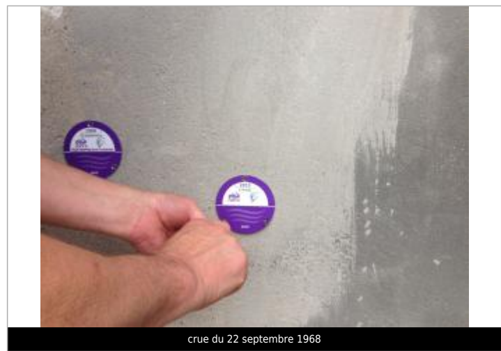
crue du 22 septembre 1968