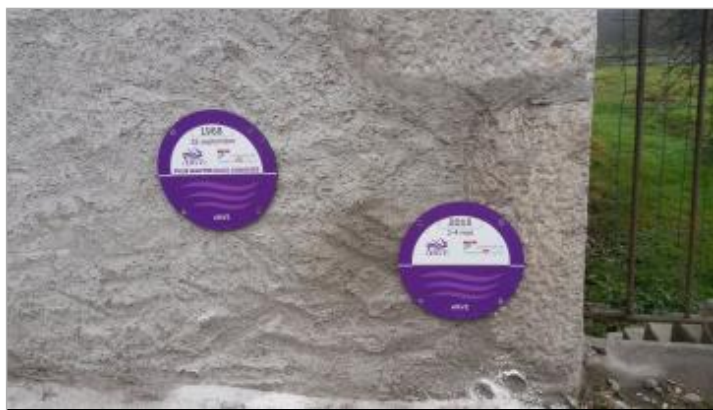
crue du 22 septembre 1968 (en haut)