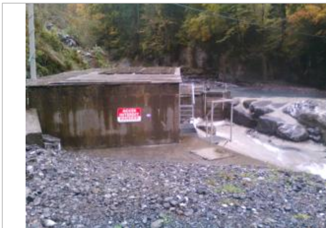
crue du 20/07/2007