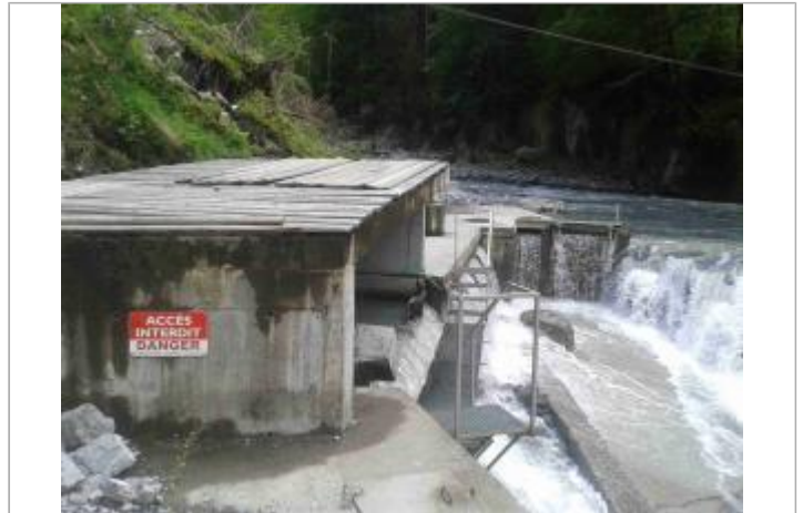
Site barrage Giffre des Fonds à Sixt-Fer-à-Cheval