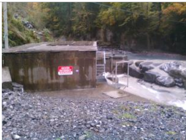
crue du 20/07/2007