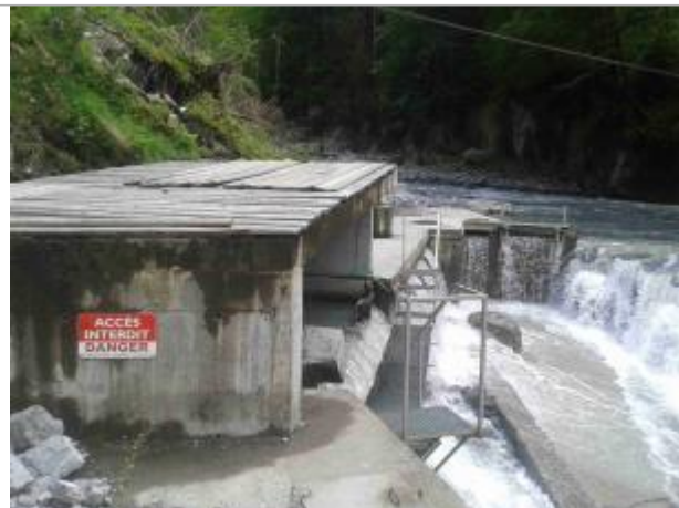
Site barrage Giffre des Fonds à Sixt-Fer-à-Cheval