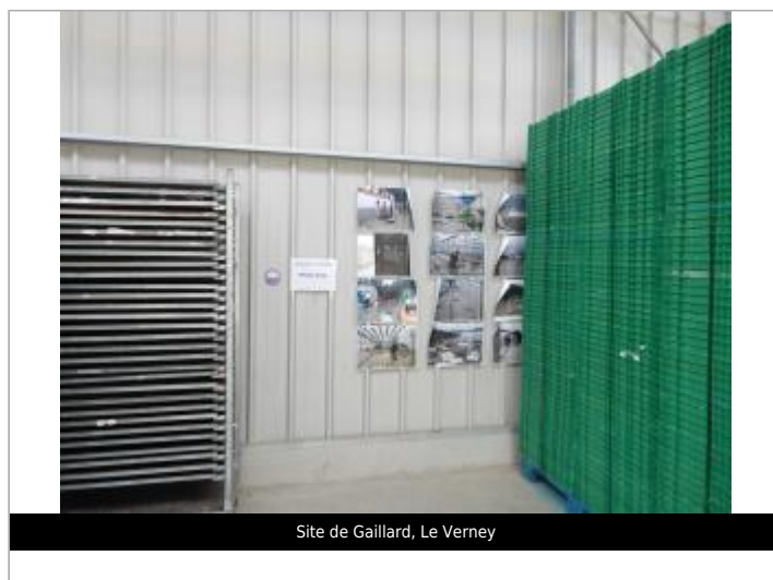
Site de Gaillard, Le Verney