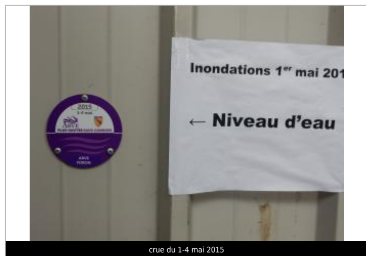
crue du 1-4 mai 2015