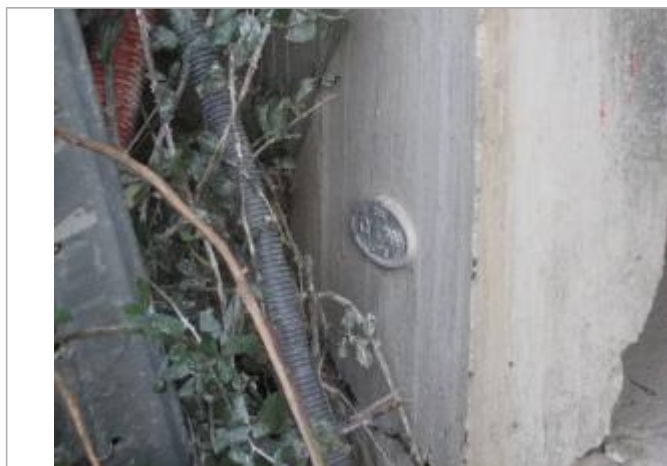
Vue du repère - Auteur : CACG

Altitude calculée de l'eau (en m) : 20.37