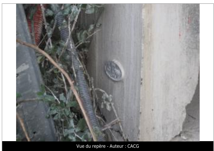
Vue du repère - Auteur : CACG

MARQUE Texte : DDE 12.11.1999 CRUE Maximum de l'inondation : Oui Visibilité : Non État du repère : Bon Pérennité : Longue