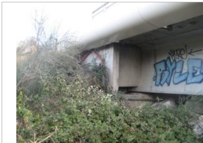
Vue du site - Auteur : CACG