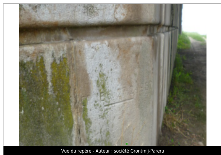
Vue du repère - Auteur : société Grontmij-Parera